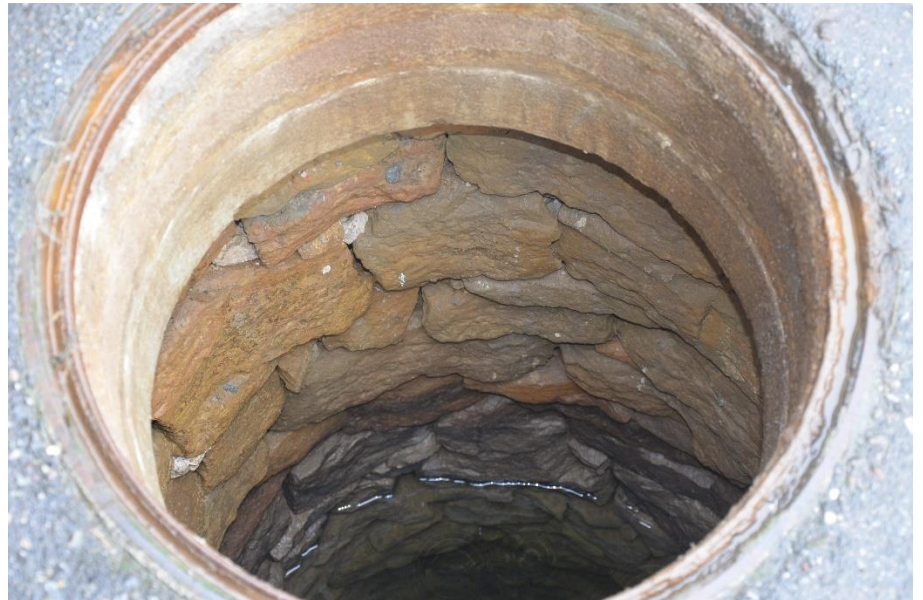
Am Stein 2, noch vorhanden