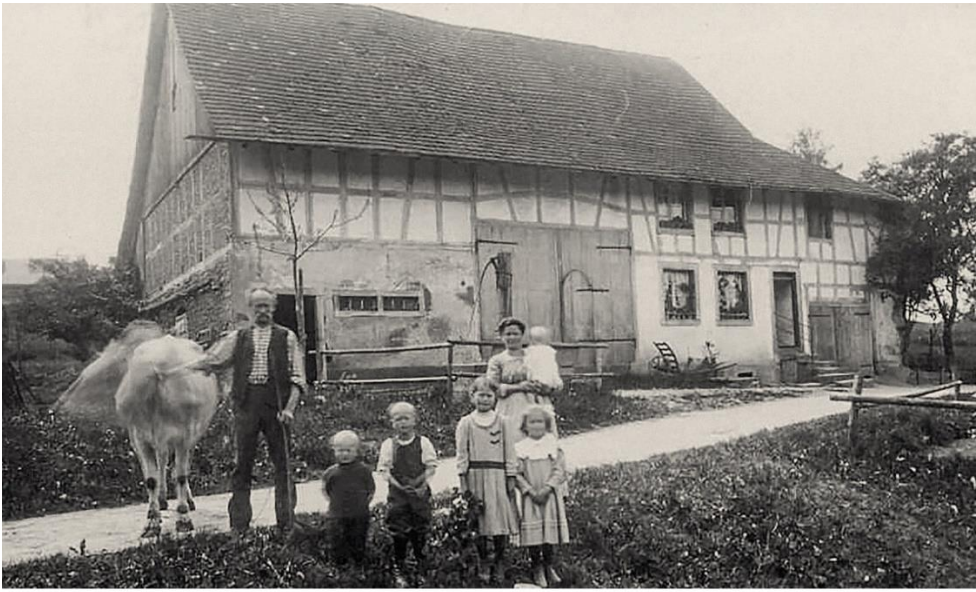
Aufnahme um 1912 (Brunnenpumpe hinter der Frau mit Kleinkind)